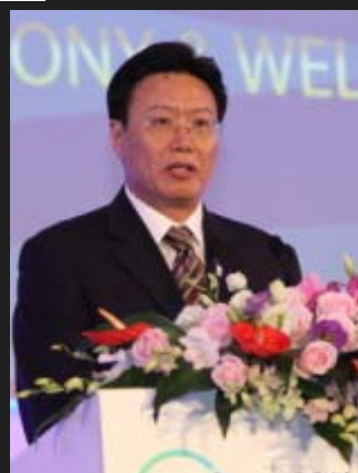
商务部部长助理、 党组成员俞建华