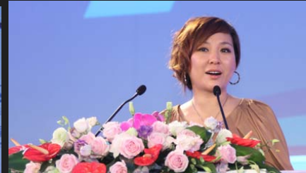
东方风行传媒集团董事长李静