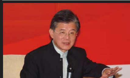
香港瑞安集团董事局主席罗康瑞