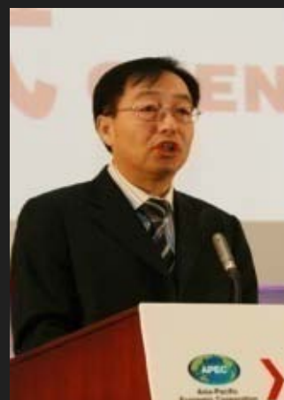
四川省副省长黄小祥