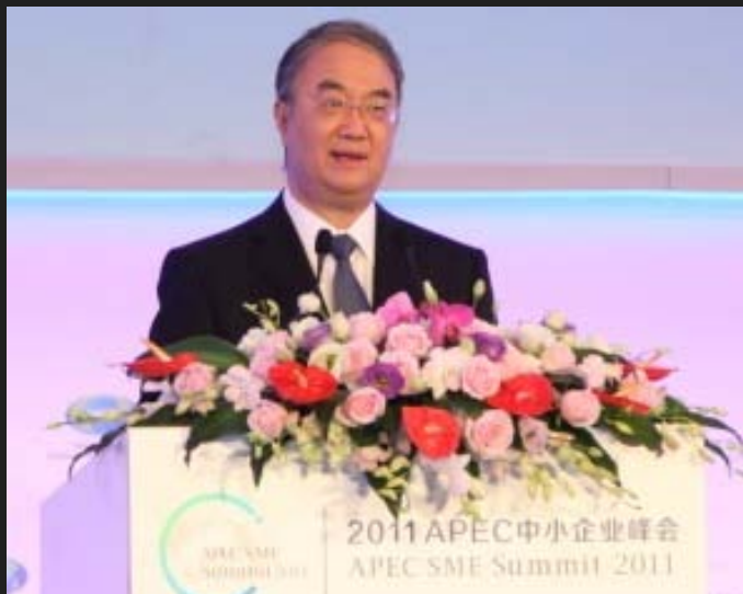
全国人大常委会副委员长桑国卫