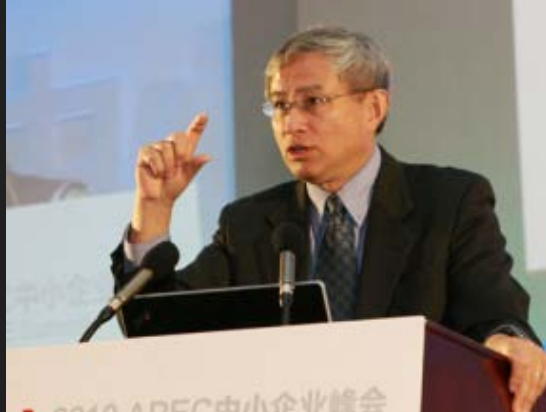
北京大学国家发展研究院院长周其仁