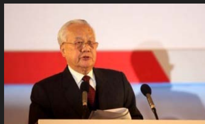
第九届全国政协副主席陈锦华