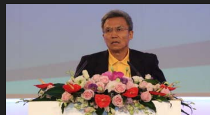
中欧国际工商学院教授许小年