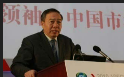
中国国际经济交流中心常务副理事长郑新立