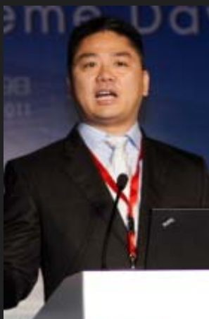
京东商城董事局 主席兼CEO刘强东