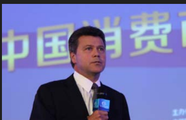
星巴克咖啡国际公司总裁约翰·卡尔弗