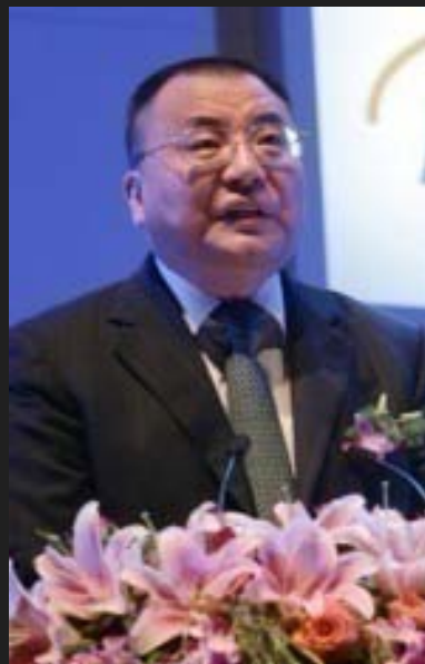
浙江省委常委、杭州市委书记王国平