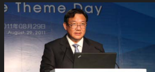
泰国副总理兼商务部长吉迪拉