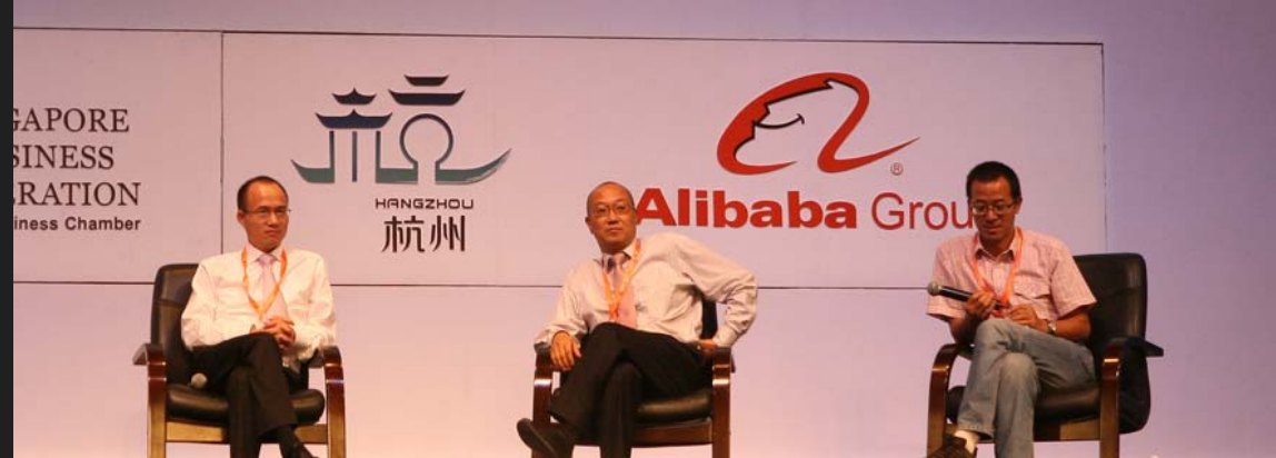
复星高科集团董事长郭广昌