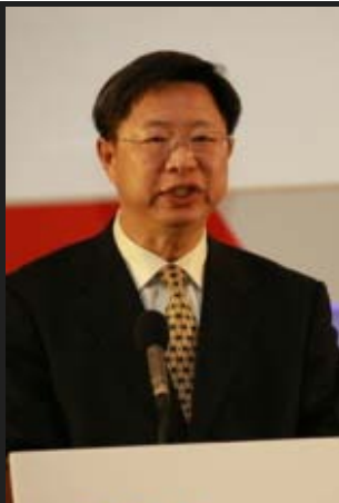
中国贸促会副会长于平