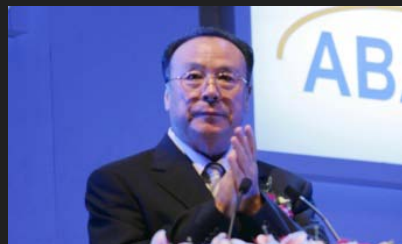
全国政协副主席白立忱