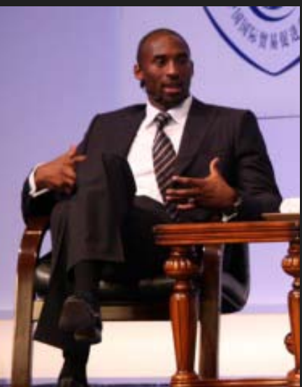
NBA篮球巨星科比布莱恩特