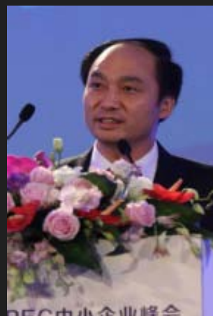
创维集团董事局主席张学斌