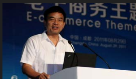
新希望集团董事长刘永好