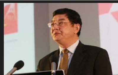
五粮液集团总裁唐桥