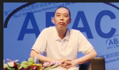
巨人集团董事长史玉柱