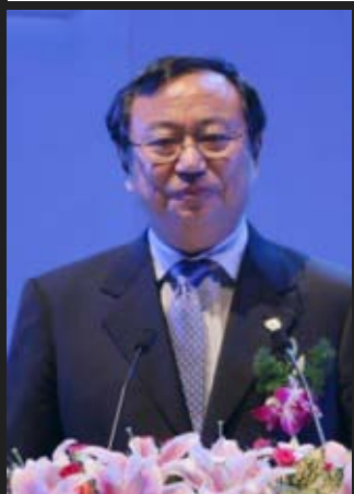
中国贸促会会长万季飞