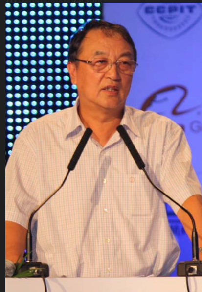
联想创始人柳传志