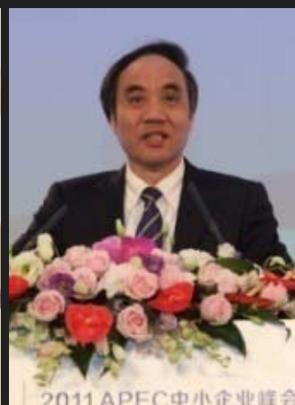
民建中央副主席辜胜阻