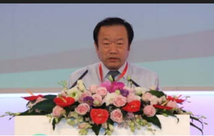
国务院参事陈全生