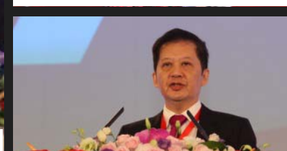
文莱原经济发展部部长Timothy Ong